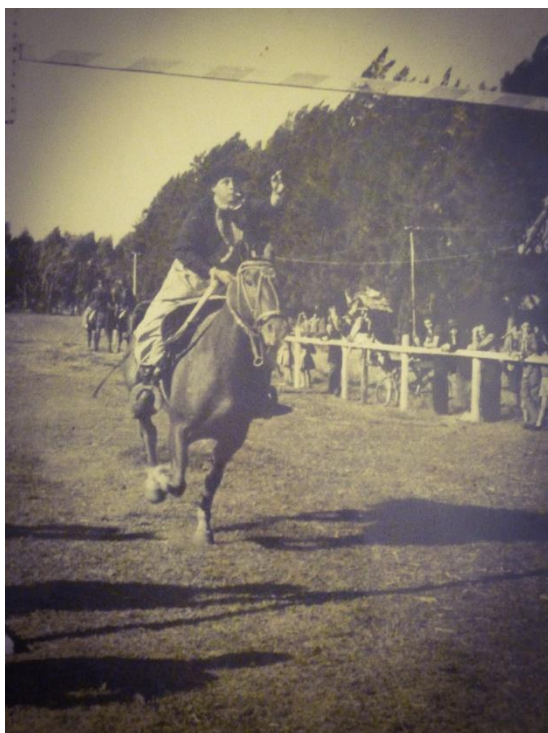
Pasada de sortija, ca. 1946.

“barra de Colegiales”, el espacio de las prácticas ecuestres en las fiestas criollas no parecía un detalle menor.